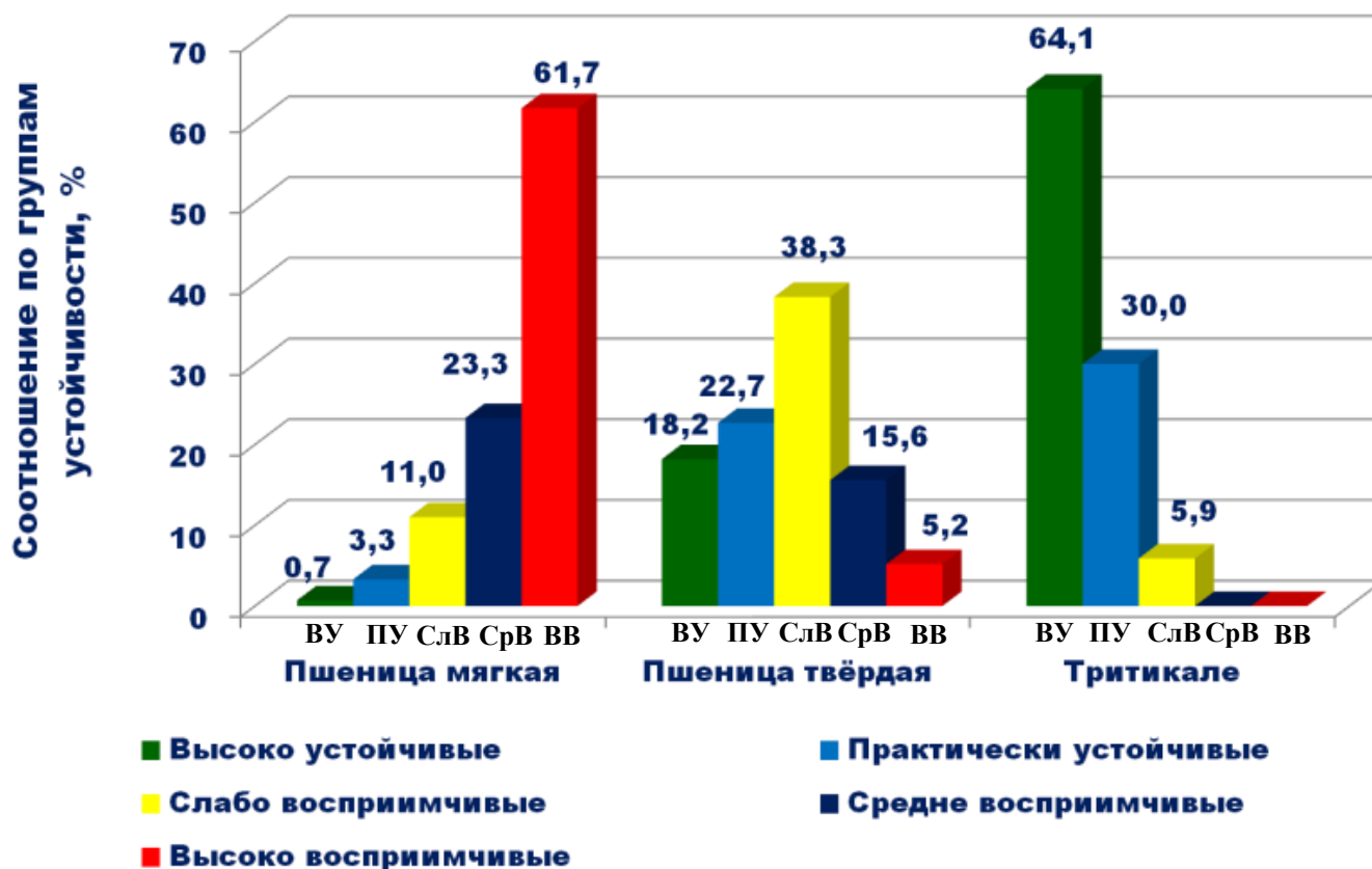
Рисунок 2 – Сравнительная характеристика пшеницы и тритикале по устойчивости к твёрдой головне, искусственный инфекционный фон, 2007-2016 гг.