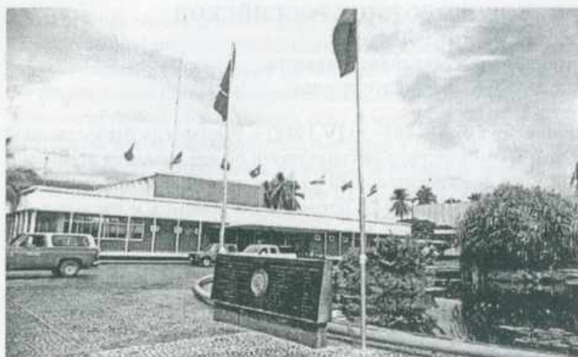
На снимке: здание офиса Международного института риса

Научные достижения Г. Куша получили широкое международное признание. Он был избран членом нескольких академий и обществ Индии, Англии, Австралии, Китая, США, Филиппин, а также России. Среди многочисленных наград доктора Куша одна имеет особую ценность – это Международный продовольственный приз (World Food Prize), который в научном сообществе считается аналогом Нобелевской премии в области сельского хозяйства. Эта награда была вручена Г. Кушу в 1996 г. за создание растений риса нового типа «Super rice».