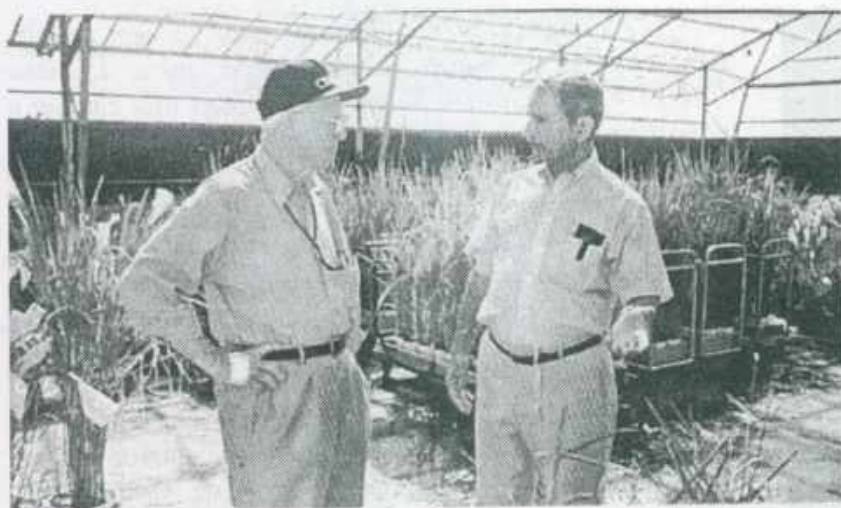
На снимке: Норман Е. Борлауг (слева) и Гурдев С. Куш — творцы «зеленой революции»

Г. Куш хотел посвятить себя медицине, но отец убедил сына поступить в сельскохозяйственный колледж (ныне сельскохозяйственный университет Пенджаба). Там он всегда был в числе лучших студентов курса. В 1955 г. Г. Куш закончил учебу и был признан лучшим студентом года. Талантливый молодой человек хотел продолжить образование, а это было возможно только за границей, но не было средств на поездку. К счастью, в это время в Англии принимали рабочих из Индии. Но у его отца не было денег на билет до Великобритании. Тогда Г. Куш одолжил деньги у нескольких родственников и отправился в туманный Альбион. Там он работал на консервной фабрике и копил средства. Через полтора года, когда собралась нужная сумма, улетел в США.